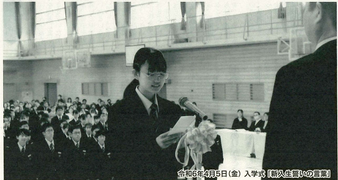
令和6年4月5日(金) 入学式『新入生誓いの言葉』

「命輝く姿」とはどんな姿でしょう。私が考える姿の一つ目は、一人一人が精一杯物事に取り組みます。授業で積極的に発言をしたり、仲間と意見を交わしながら問題に取り組んだり、部活動で諦めずにボールを追ったり、額に汗して集中して演奏したりする姿は光り輝いています。二つ目は、人を笑顔にしたり、人のために動く姿です。みんなのために動くことで、仲間の笑顔を生み出したり、感謝してもらえたりする喜びを実感したりすることが出来ます。そして、その姿からは命の輝きを感じます。三つ目は、仲間と創り上げる姿です。共に知